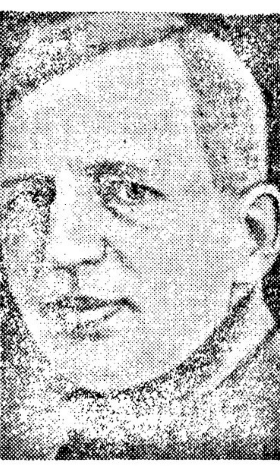
А. С. Бубнов