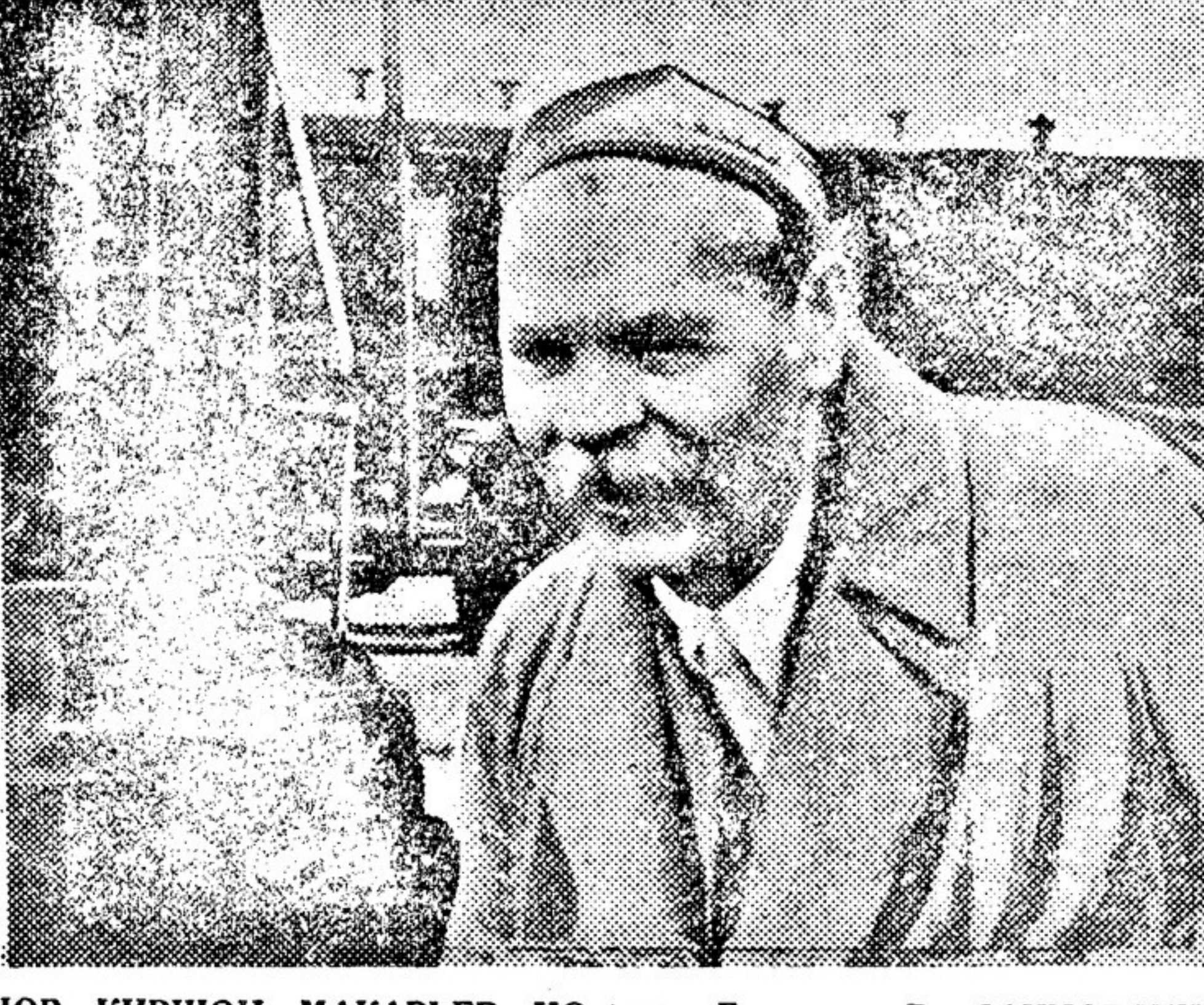
М. Горького — В. САХНОВСКИЙ, И. ГОРЬКОГО — В. САХНОВСКИЙ, И. ГОРЬКОГО — В. САХНОВСКИЙ...